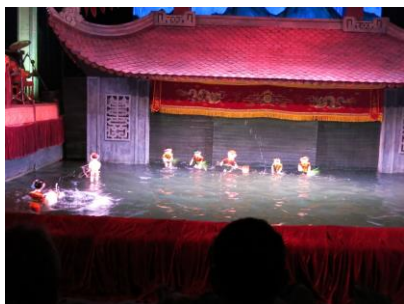
写真1 水中劇 上手く操作している

戦争にもめげず、確実に発展しつつある真面目な国で、今後何か縁があればと感じました。