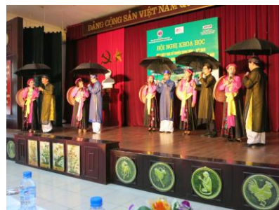
写真3 病院職員による歓迎の歌