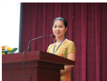
写真6 ベトナムの薬剤師さんの薬草についての講演