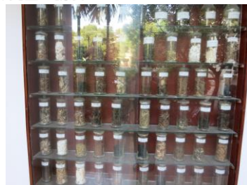
写真7 ベトナムで使われている薬草