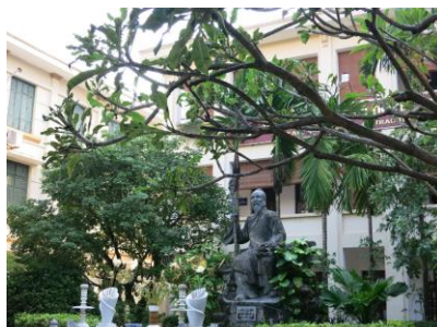
写真2 病院庭のホーチミン像