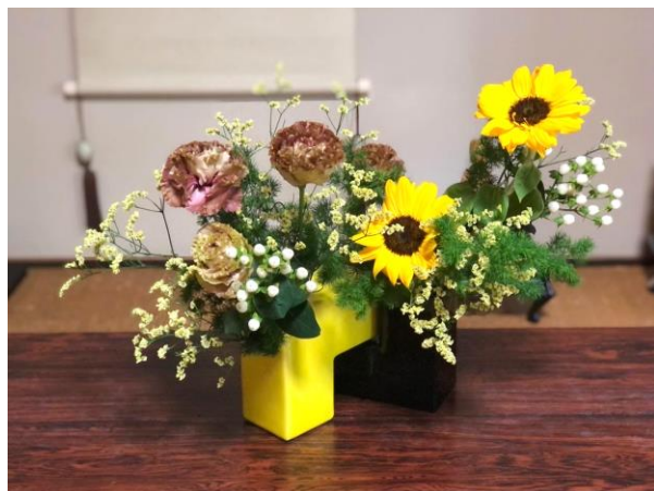
ひまわりの花言葉 「未来をみつめて」「高貴」

今年の梅雨はせっかちさん。さっさと明けてしまいました。そして早速の猛暑。参ります。