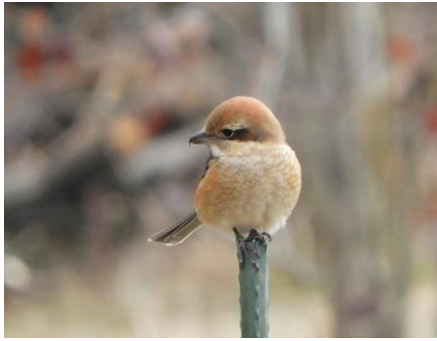
もず (2022.2.6) S.S.