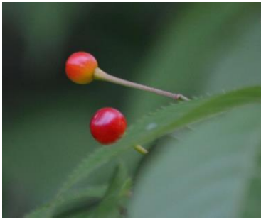
オオシマザクラの実 S.S