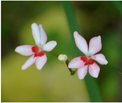
ヒメオウギアヤメ SS

天候が不安定 コロナで人の心も 不安定 どちらをみても マスク姿 下をむかない 病んでも 老いても 上をむいて 歩く